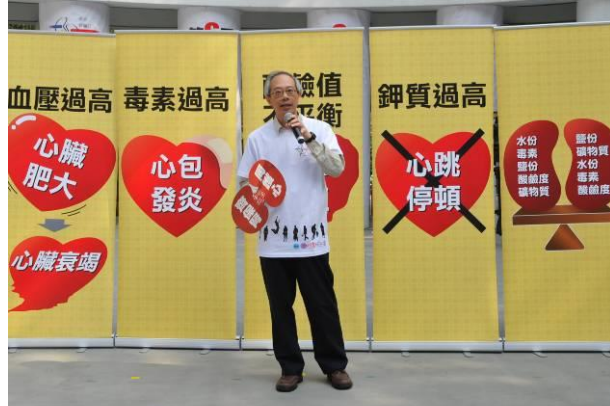
主辦代表致歡迎辭 香港腎科學會主席梁誌邦醫生