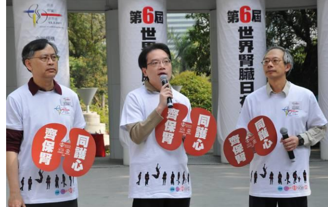
醫院管理局聯網服務總監張偉麟醫生