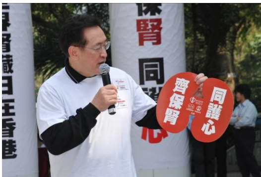
主禮嘉賓致辭 食物及衛生局局長周一嶽醫生