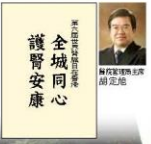
「第六屆世界腎臟日在香港」於三月十三日假香港會議展覽中心舉行，八百多名醫務人員、專業及家屬團體參加，由黃及陳主席主持開幕禮。