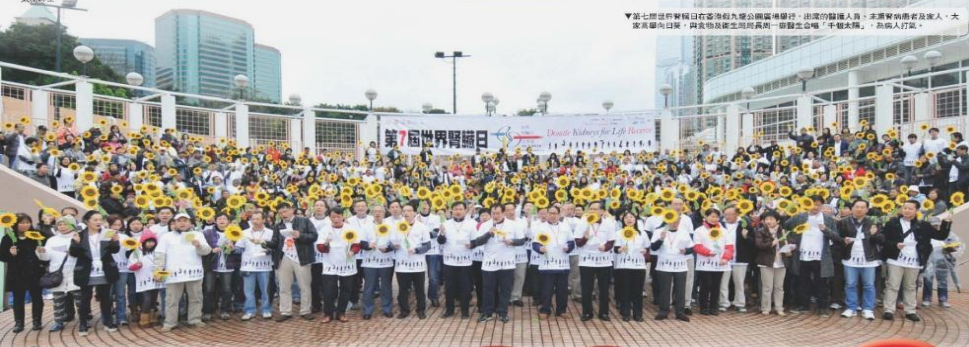
▲第七屆世界腎臟日在香港九龍公園廣場舉行。出席的醫護人員、本港捐腎者及其家人、大眾響應捐腎，與食物及衛生局局長一齊發給「手錶手鐲」，為病人打氣。

有關「第七屆世界腎臟日在香港」之活動 及「腎病自我評估」 於二零一二年三月二十九日 在本港八份報章全版刊登