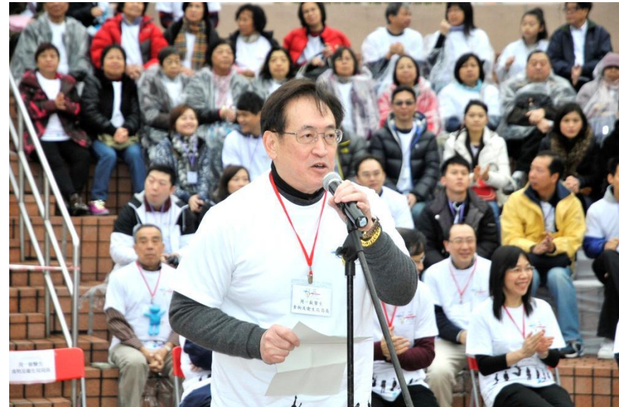
主禮嘉賓致辭 食物及衛生局局長周一嶽醫生