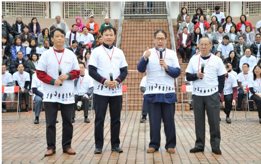
嘉賓致辭（從右至左） 香港腎臟基金會贊助人余宇康教授 香港腎臟基金會會長梁智鴻醫生 醫院管理局總裁梁栢賢醫生 國際腎科學會常委李錦滔教授